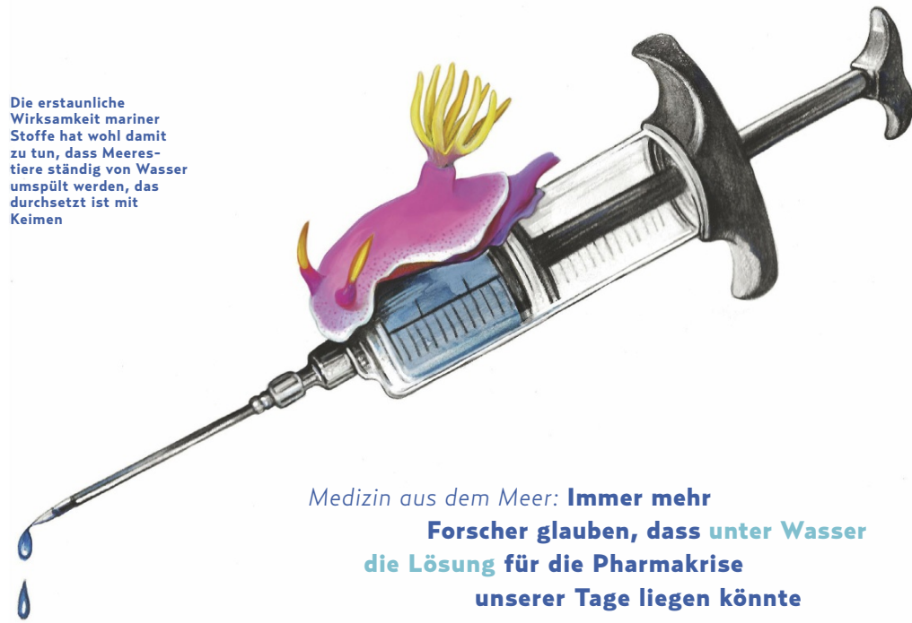
Die erstaunliche Wirksamkeit mariner Stoffe hat wohl damit zu tun, dass Meerestiere ständig von Wasser umspült werden, das durchsetzt ist mit Keimen

Die Chemikerin hofft, im Schleim von Fischen Mikroben zu entdecken, aus denen sich Medikamente entwickeln lassen. Erste Ergebnisse ihrer Untersuchungen stimmen zuversichtlich: So trägt zum Beispiel der Brandungsbarsch Zalemibus rosaceus ein Bakterium auf seiner Haut,